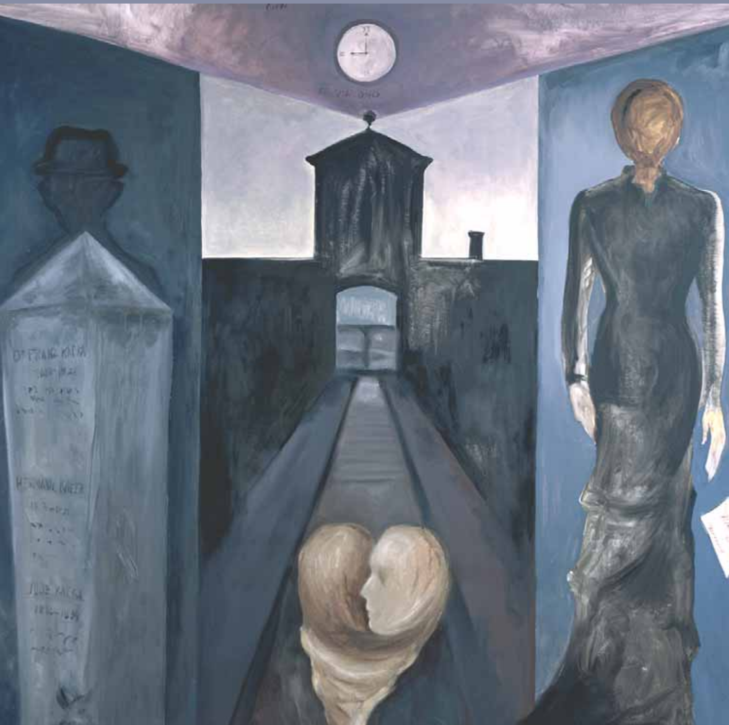
Sofia Gandarias: Die Liebenden - Schicksal 200 x 190 cm Öl, Leinwand, Seidenpapier, 2008